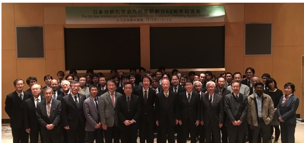
分析化学会九州支部60周年事業記念式典での参加者集合写真