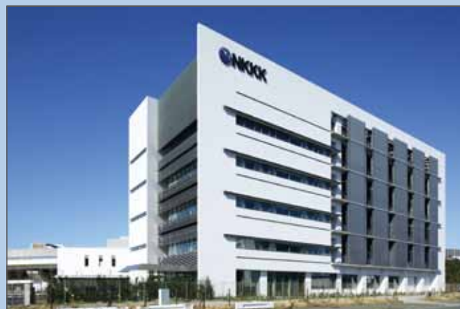
▲横浜分析センター