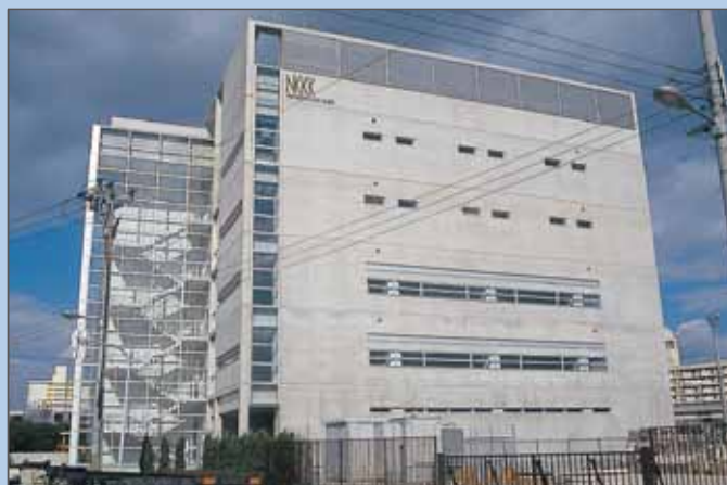
▲大阪分析センター