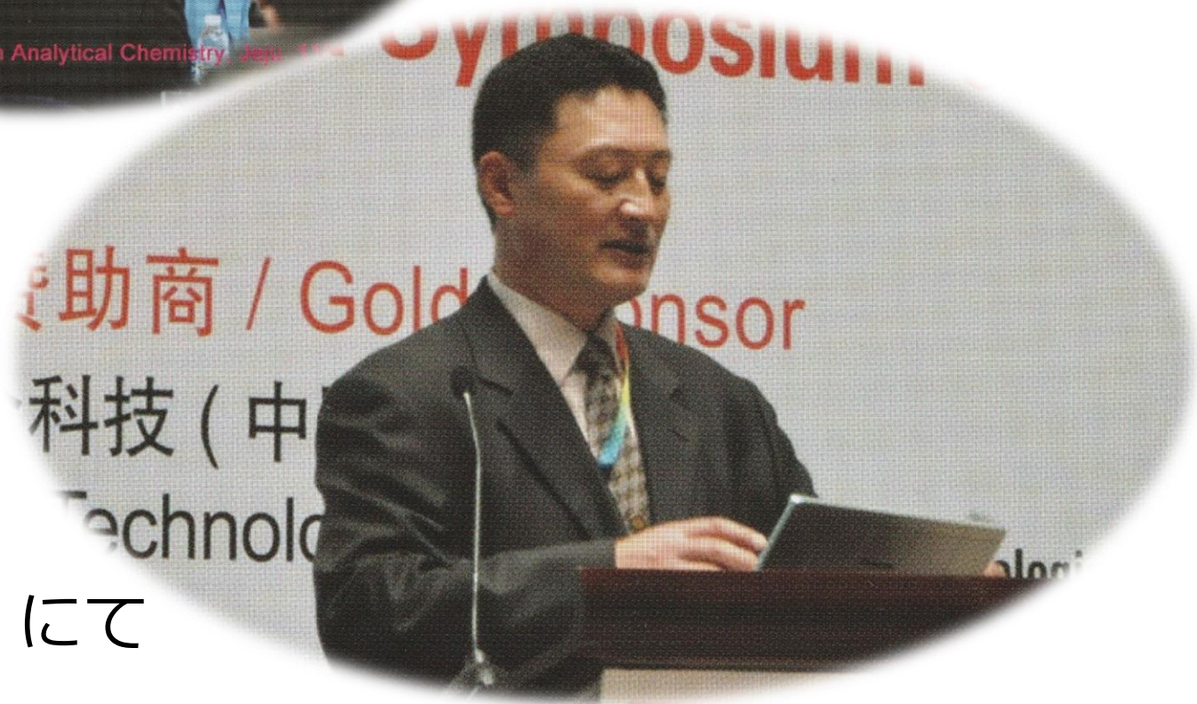
2011 CJK Symposium on Analytical Chemistry, Jeju, Korea

CJK Symposium Anal.Sci. 特集予備審査委員会発足させる。全体で10報程度のミニ特集号 (CJKとイオンクロ国際学会)