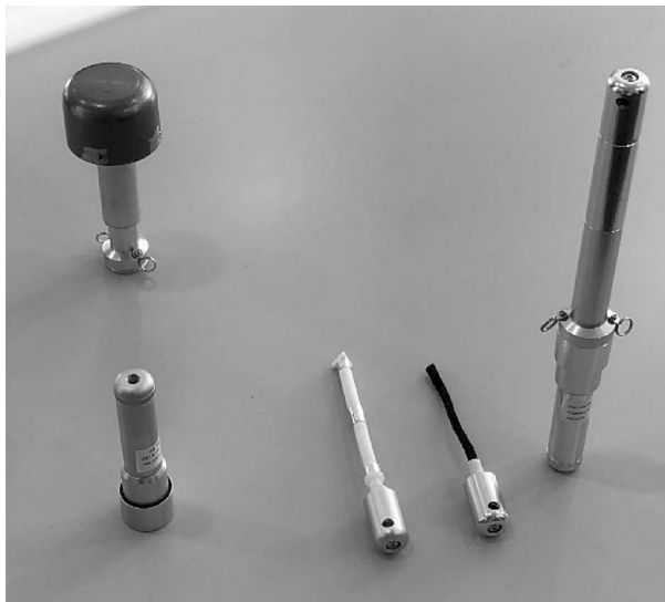
写真3 独自に開発された大気捕集管。右端の金属管内には乾電池とポリマー被覆の石英管が入っている。

り、例えば、研究所近郊において災害等が発生した場合は、その発生場所周辺の大気をサンプリングされている。その大気サンプリング時に使用している、独自に開発された大気捕集管を見せていただいた(写真3)。金属製筒の内部には、効率良く捕集するために空気を循環させることを目的とした小型電動ファンのための単3電池の他、ポリマー被覆の石英管などを入れて使用する仕様となっており、雨よけも付けられる。