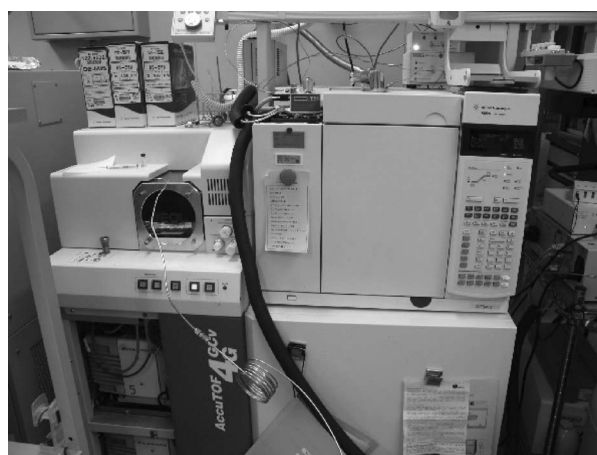
写真2 ノンターゲット分析用GC×GC-TOFMS