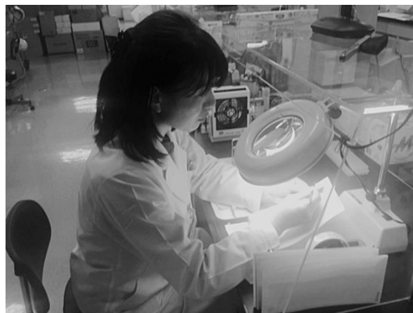
写真3 DNAの抽出のためのサラブレッドの鬣（毛根付き）を裁断する作業

国内で生まれたサラブレッド（7000頭/年）の血統登録は、生産者がジャパン・スタッドブック・インターナショナル（JAIRS：サラブレッドの血統登録団体）に依