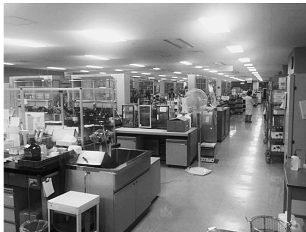
写真1 薬品分析部の前処理作業エリア

競走馬は血液を採取して検査を行っている。本研究所は、競走馬の薬物検査を行う国内唯一の機関であることから、中央競馬及び地方競馬において開催される北海道から九州まで日本各地の競馬場から、年間で約44000検体が集まっている。中央競馬は基本的に週末にレースが開催されることもあり、毎週月曜日に多数の検体が到着するそうである。レース終了後に採取された検体は競馬場でそれぞれA検体とB検体に分割されており、研究所に到着すると、A検体はすぐに検査を始めるが、B検体は封緘が施された容器ごと敷地内にある別棟の冷蔵庫で厳重な管理のもと保管され、A検体から薬物が検出・同定された時に、専門家の立ち合いの下で再検査される。現在、薬物検査における分析装置は主にGC-MS及びLC-MS/MSが用いられている。GC-MSを使用する尿の検査法では、初めに尿検体は固相抽出により分画抽出され、各分画をGC-MSで分析するスクリーニング検査を行う。禁止されている薬物が検出された場合は、主にLC-MS/MSで分析している確認検査によりその薬物の同定が行われている。GC-MSによるスクリーニング検査では、平日の日中に固相抽出による前処理を行い、翌朝までにすべての検体の分析が終了する工程となっている。毎日200件以上の検体を分析するた