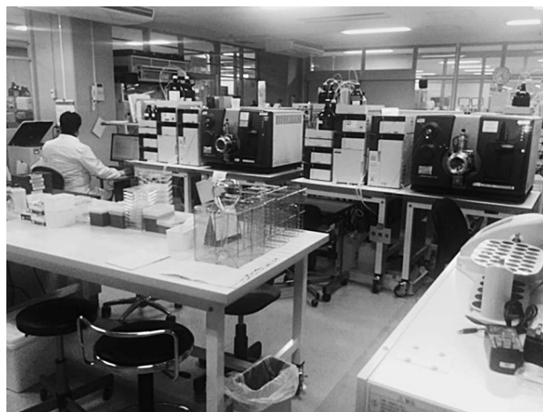
写真2 薬品分析部の分析機器室