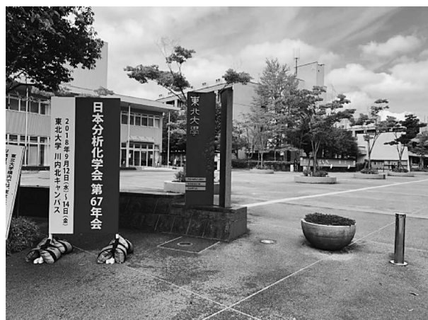
東北大学川内北キャンパス(講演会場)

依頼講演(34件)、一般講演(262件)、テクノレビュー(2件)が、東北大学川内北キャンパスA棟、B棟、C棟の12会場で行われた。研究懇談会は、1日目の午前に3件、午後に7件、2日目の午前に3件、3日目の午前に6件の合計19件が開催され、それぞれの世話人のアレンジによる講演が行われた。また、ポスター発表は、1日目と2日目に若手ポスター発表173件が、1日目と3日目には一般ポスター発表141件、テクノレビューポスター2件が行われた。